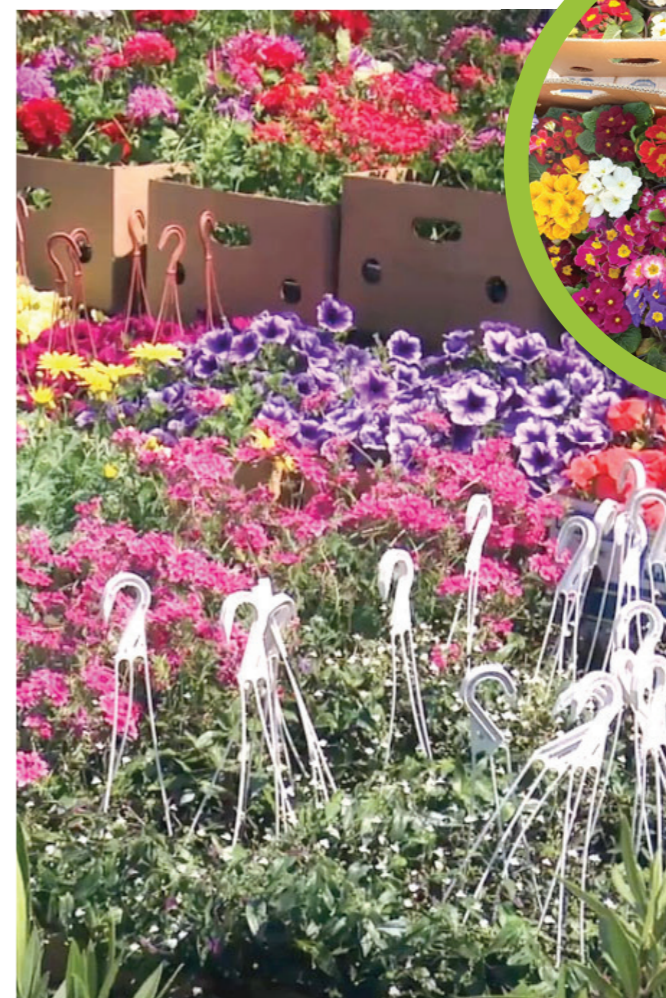
ТЦ КРЊАЧА НАЈВЕЋА ГРАДСКА ПИЈАЦА ЦВЕЋА

Саксију или жардињеру пробушите да сувишна вода може да отиче. Ставите слој од пар центиметара дренаже (крупније каменчиће или изломљени цреп) који служи да се вода цеди и не „удави“ корен. Преко дренаже ставите земљу и посадите биљку. Имајте у виду да ће се земља мало слегнути, зато биљку немојте сувише дубоко садити. Када цвеће садите у саксији, увек га посадите у центар саксије. Земљу немојте набијати око корена, јер ћете тиме истиснути сав ваздух, па ће се биљка брзо